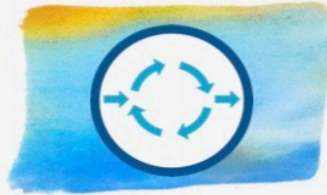
Kurze Zyklen, Regelmäßige Auswertung